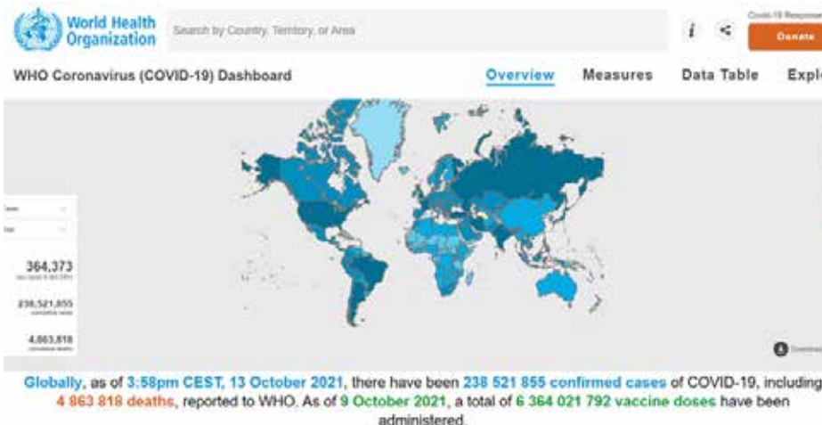
Kuva 1: Koronavirus (Covid-19) ei ole laajoista rokotuksista huolimatta poistunut uhkana maailmasta, korona vaikuttaa myös koulutustoimintaan Suomessa vuoden 2022 ajan (lähde THL, lokakuu 2021).

Uudistumisen strategialla vastataan ammatillisen koulutuksen reformin ja toimintaympäristön muuttuviin haasteisiin sekä asiakkaan/opiskelijan todellisiin tarpeisiin ja odotuksiin tiiviissä yhteistyössä kumppanuuksverkostojen kanssa. Uuden toimintalain ja rahoituslain tuoma muutos edellyttää koulutuksen järjestäjältä rakenteiden ja prosessien rohkeaa uudistamista. Koulutuksen resurssit tulevat määräytymään jatkossa erilaisten tuloksellisuustekijöiden seurauksena. Näitä ovat mm. opiskelijoiden suoritukset (suoritusrahoitus) ja opiskelijoiden ja työelämän palaute koulutuksen laadusta (vaikuttavuusrahoitus). Koulutustuotteiden ja opetus- ja oppimisprosessin uudistaminen on välttämätöntä vetovoimaisuuden ja hakutoiveiden parantamiseksi. Kilpailu asiakkaista kovenee