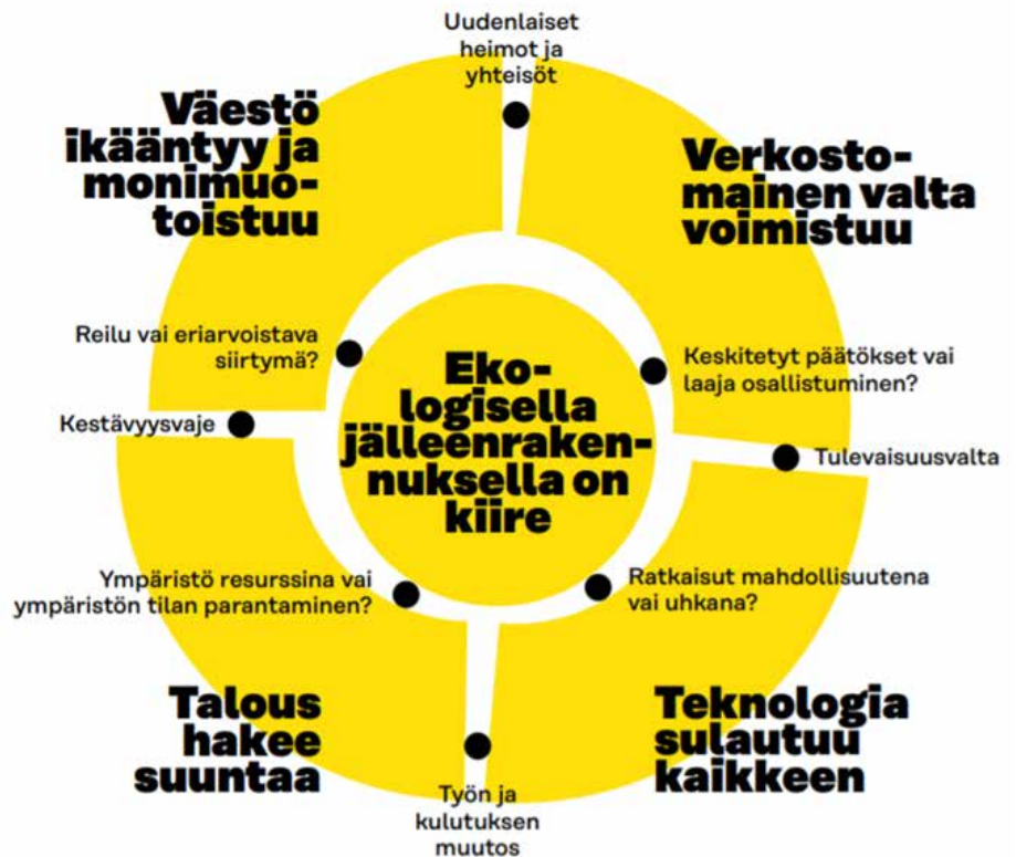
Kuva 3: Sitran megatrendit luovat kokonaiskuvan Suomen kannalta merkittävistä yhteiskunnallisista muutoksista (Sitra 2020).

Uudelle valtuustokaudelle 2021-2025 lähdetään taloudellisesti vakaammassa tilanteessa kuin neljä vuotta sitten. Samiedusta on tullut paikallisen toiminnan lisäksi