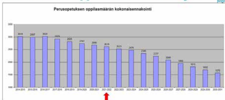
Kaavio 2: Savonlinnan kaupungin perusopetuksen oppilasmääräennuste