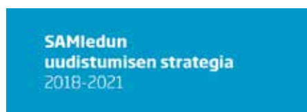
Kuva 2: Samiedun strategia 2018-2021 tehtiin vuoden 2017 aikana ammatillisen koulutuksen reformia ennakkoiden.

Muutkin strategiset pää tavoitteet ovat toteutuneet, erityisesti talouden tasapainottaminen on onnistunut yli tavoitetilan. Uhkana kuitenkin on ammatillisen koulutuksen rahoituksen pieneneminen, se vaikuttaa suoraan kaikkiin suomalaisiin ammatillisiin kouluttajiin.