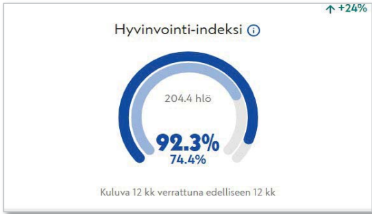
Kuva 1. Hyvinvointi-indeksin 12 kk:n kehitys